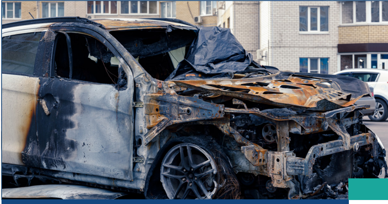
صورة رقم [1]

مناطق الفحص: للعمل على تقييم أضرار مصدر الاحتراق يجب فحص خطوط الوقود وحجرة المحرك وأنظمة العادم بحثًا عن علامات الاحتراق فيها بما في ذلك أي مكونات ذائبة نتيجة الحرارة المرتفعة وخزانات الوقود المثقوبة.