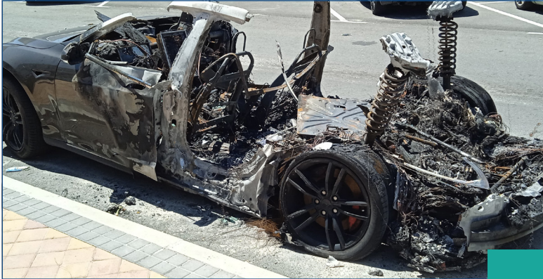
صورة رقم [2]

مناطق الفحص: للتحقق من مصدر الاحتراق يجب الكشف على خلايا البطارية، والأسلاك الكهربائية ذات اللون البرتقالي التالفة، وعلامات ارتفاع درجة الحرارة في كل من المحرك الكهربائي ومكونات محرك الاحتراق الداخلي بالإضافة للكشف على مكونات انظمة الوقود.